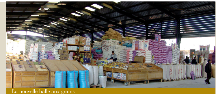
La nouvelle halle aux grains

L'Agence privilégie la négociation aussi bien avec les propriétaires des immeubles qu'avec les commerçants et les ménages. Concernant cette dernière catégorie, l'Agence assure un accompagnement social visant à s'approcher beaucoup plus des concernés et à appréhender leurs demandes. Organisés en association de 74 locataires, ces derniers ont été invités à des réunions de négociation avec le comité des acquisitions foncières et des indemnités, dans le cadre desquelles a été proposée, pour chaque ménage, une indemnité basée sur la durée de résidence et le montant du loyer. Ces réunions se tiennent régulièrement dans le but de trouver un consensus qui prendra en considération chaque cas social.