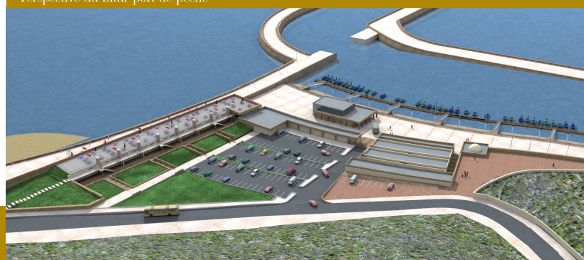
Perspective du futur port de pêche

Par conséquent, il est nécessaire de prendre en considération les aspects humains comme une étape cruciale pour la résolution durable du problème de la salubrité de l'habitat. Ceci dans le but d'éviter le transfert des facteurs qui en sont à l'origine vers de nouveaux espaces.