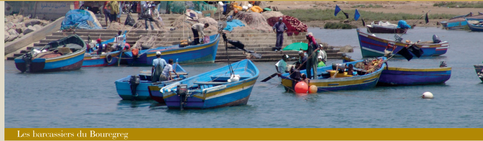
Les barcassiers du Bouregreg

Ainsi, différentes activités sociales ont été organisées afin d'améliorer les conditions de vie des catégories défavorisées, notamment une nouvelle halle aux grains réalisée par l'Agence en