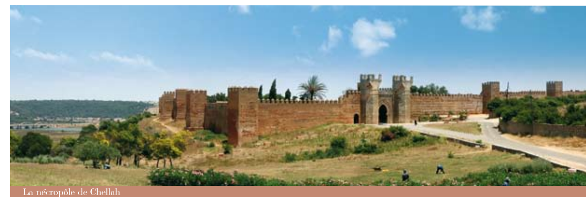
La nécropole de Chellah

Parmi les résultats des fouilles figure la découverte des fondations de Ribat Tachfine datant de la première moitié du 12 e siècle et de la muraille almoravide et des portes à deux tours, qui remontent à l'époque Alaouite du 17 e siècle, probablement au temps de Moulay Rachid. Par ailleurs, les fouilles ont également permis la découverte de canons du 18 e et 19 e siècle et d'ancre du début du 20 e siècle.