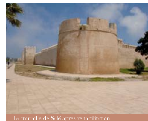
La muraille de Salé après réhabilitation

Soucieuse de la préservation et la mise en valeur de cet endroit historique et patrimonial, l'Agence Bouregreg a lancé une mission de réhabilitation du Chellah en partenariat avec l'UNESCO. Ce partenariat a permis à une