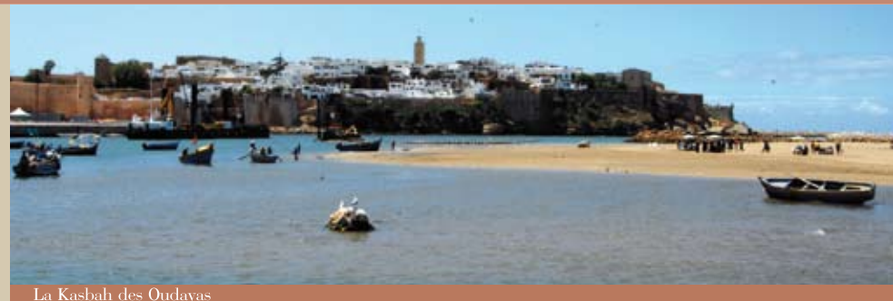
La Kasbah des Oudayas

Considérée comme le monument phare de la