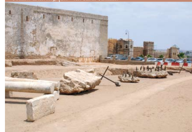
Fouilles archéologiques - site Ribat Tachfine

Dans le cadre d'opérations ponctuelles tendant à restaurer certains monuments, une opération de réhabilitation de bâtiments historiques sera lancée sur le front fluvial de la médina de Rabat. Elle porte sur la réhabilitation de maisons et fondouks aujourd'hui tombant en ruine.